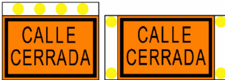
Figura 28 - Disposición de las luces de advertencia intermitentes

Cada señal luminosa debe contar con 4 dispositivos luminosos, que deben colocarse fuera de la superficie mínima de la señal de información, dispuestos como se indica en la Figura 28.